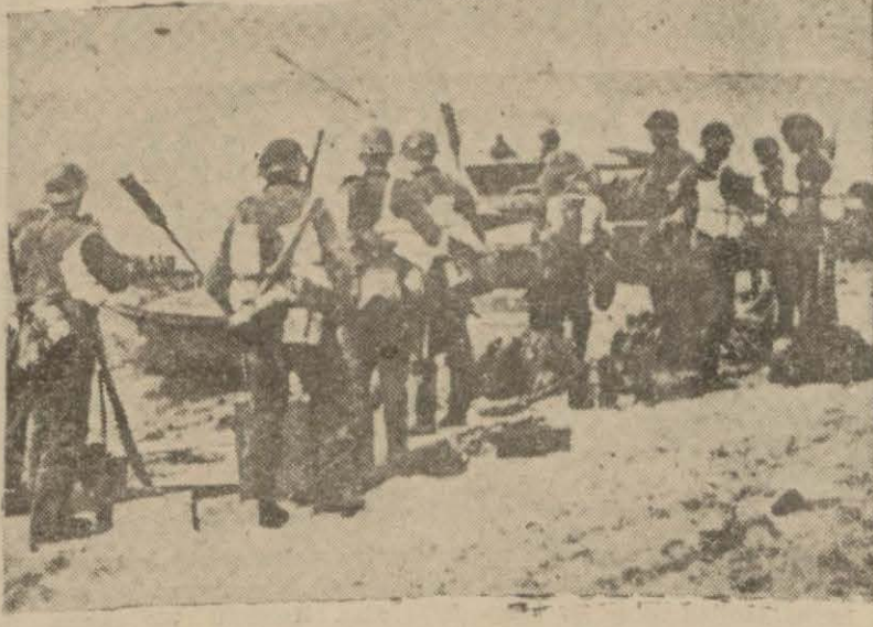
Özel adasını işgal eden Alman kuvvetleri hareket esnasında